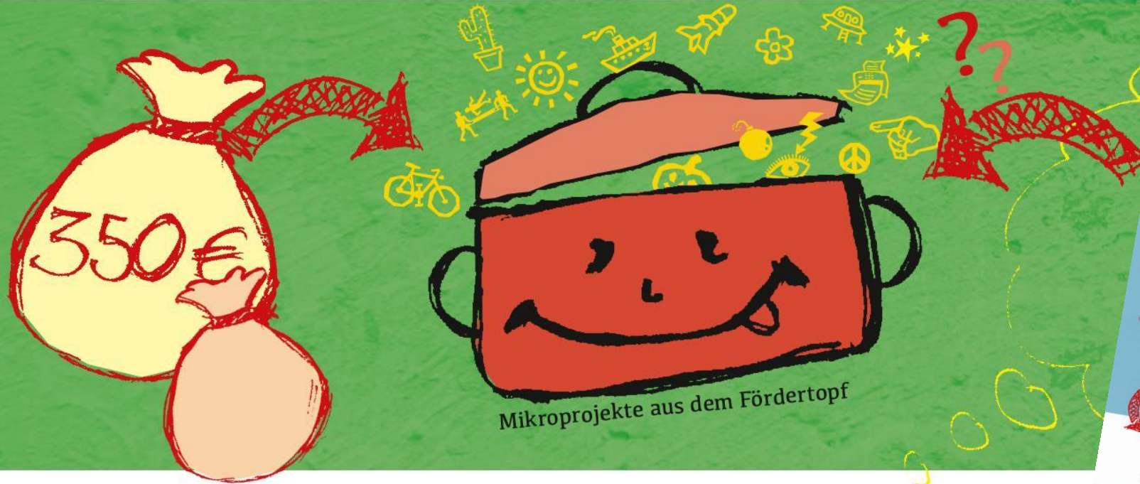
Mikroprojekte aus dem Fördertopf

... und verändere Niedernberg als Projektmacher/in.