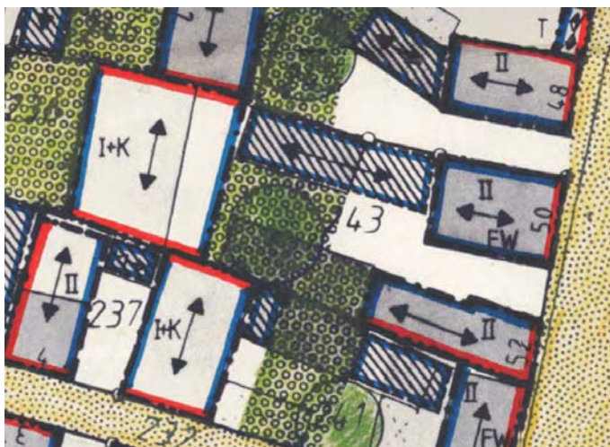
Ausschnitt aus dem bestehenden Bebauungsplan „Altbaugeliet I und II“, Plan unmaßstäblich

Die Forderung, dass auf Gartenflächen keinerlei Bebauung zulässig ist, wurde mit der Tektur 04.11.1998 aufgehoben.