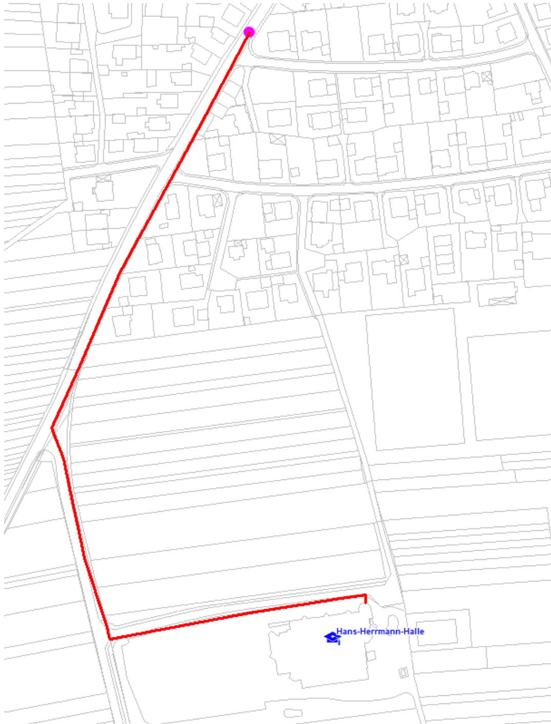
Abbildung 26: Anbindungsmöglichkeit Hans-Herrmann Halle