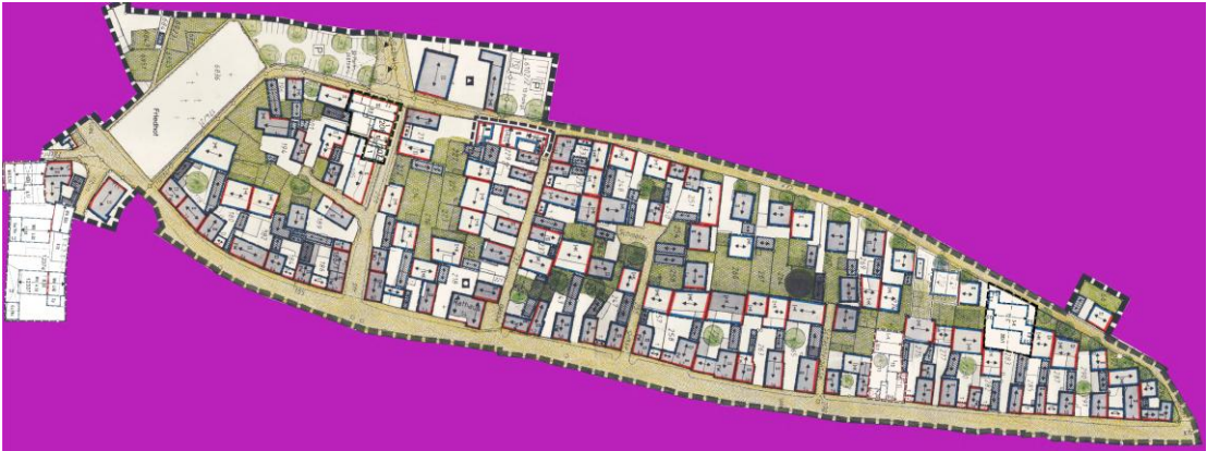
Plan unmaßstäblich, Geobasisdaten © Bayerische Vermessungsverwaltung

Im Bauleitplan waren folgende wesentliche Festsetzungen aufgeführt: